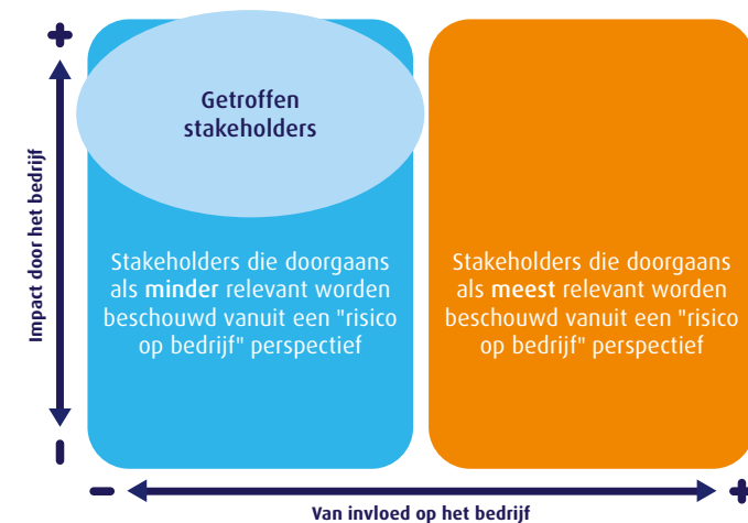
Figuur 1 – Identificeren van stakeholders vanuit verantwoord ondernemen.

Om maatschappelijk verantwoord te ondernemen, is het belangrijk een juist en volledig beeld te hebben van de risico's op negatieve impact op mens, milieu en natuur in jouw waardeketen die zijn toe te schrijven aan jouw bedrijfsvoering. Ook moet je eventuele misstanden voorkomen of aanpakken. Richt je op de personen en groepen op wiens rechten of belangen de activiteiten van je bedrijf een negatieve of positieve impact (kunnen) hebben, oftewel je (potentieel) getroffen stakeholders. Voorbeelden zijn werkenden in je keten en omwonenden rond productielocaties, maar ook 'stakeholders zonder stem' zoals het milieu, de natuur en toekomstige generaties. Meestal zijn deze stakeholders niet tot nauwelijks in de positie om invloed uit te oefenen op jouw bedrijf. Om deze stakeholders te identificeren, is het noodzakelijk inzicht te hebben in jouw waardeketen en te redeneren vanuit risico's op negatieve impact op mens en milieu in plaats van uit de risico's voor jouw bedrijf (zie figuur 1).