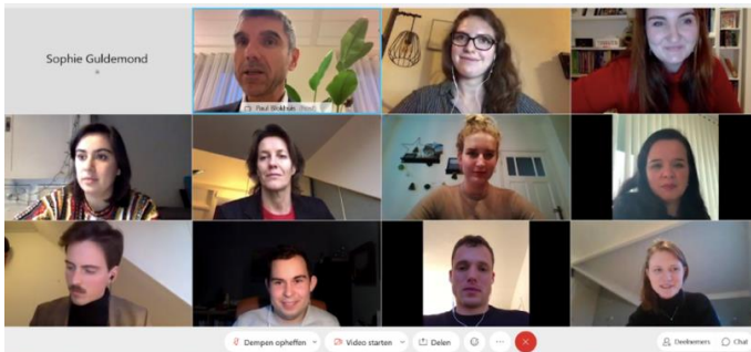
Gesprek met staatssecretaris Blokhuis, over de resultaten uit de online dialoog 17-11-2020