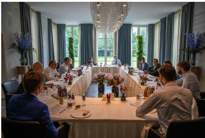
Bezoek aan Catshuis door Coalitie-Y