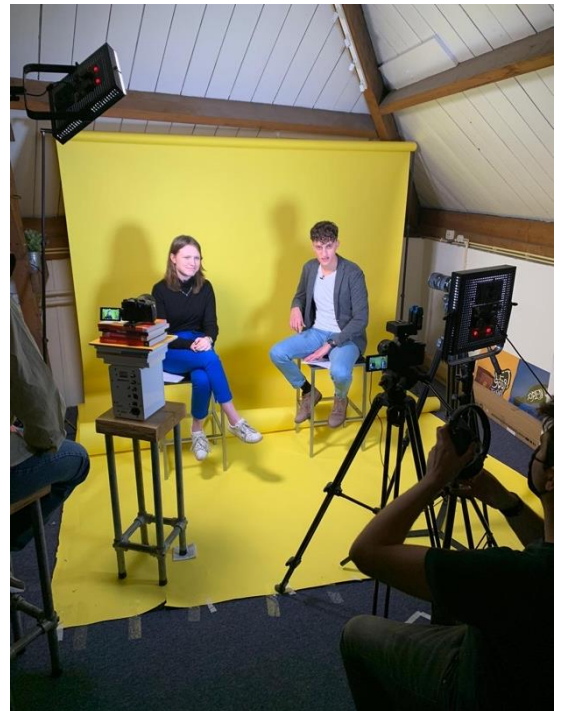
Opnames video voor de overhandiging van het advies