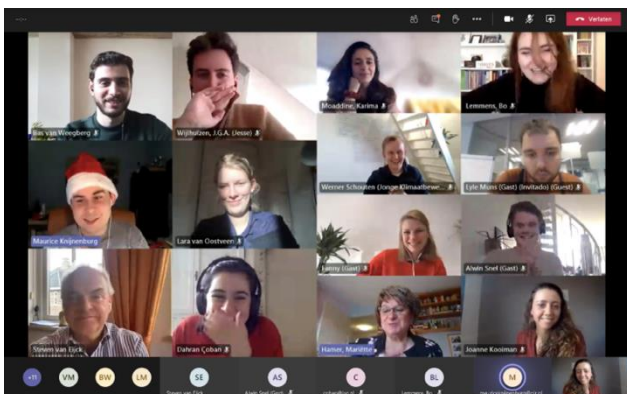
Online vergadering JDC 16-12-2020