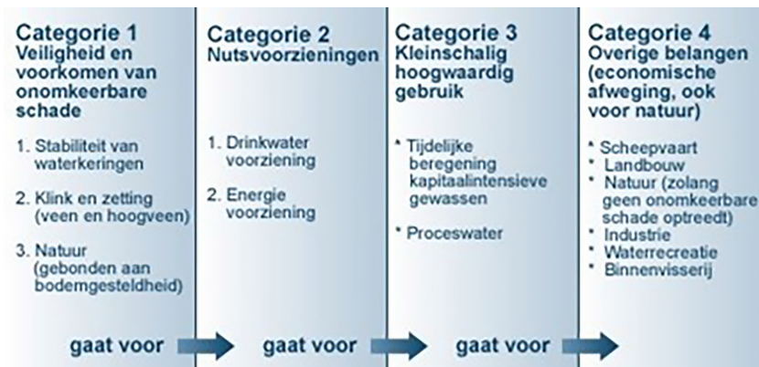
Figuur 2.1 De verdringingsreeks

Als er gedurende langere tijd en/of meer structureel sprake is van droogte, is een rechtvaardige verdeling van watergebruik dan voldoende gewaarborgd? 6 De verdringingsreeks geldt alleen voor noodgevallen en alleen voor een korte periode op een afgebakende plek. Daarmee kan de verdringingsreeks geen oplossing zijn voor een verdelingsvraagstuk dat in de toekomst niet meer uitsluitend in de ‘traditionele’ droge zomermaanden speelt en meer structureel van aard wordt. Met beide uitersten moet passend worden omgegaan. Er ligt daarom een opgave in het zoeken naar maatregelen die zoetwatertekorten zoveel mogelijk voorkomen (in samenhang met maatregelen tegen wateroverlast) en naar een aanpak die een structurele, rechtvaardige prioritering van het watergebruik biedt.